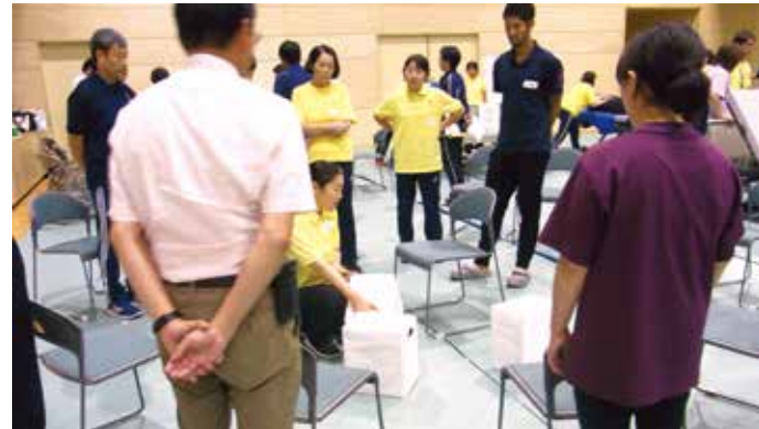
▲下に置いてある重い物を持ち上げる時のノーリフティングケア

これは、それぞれの社協がもつ課題について協議・研修をすることで、職員の資質向上及び社協間の連携強化を促進し、社協の組織力と実践力の一層の向上を図ることを目的として毎年地区の持ち回りで開催しているものです。