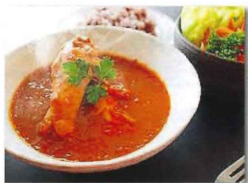
12月は “チキンカレー” (予定・イメージ写真)