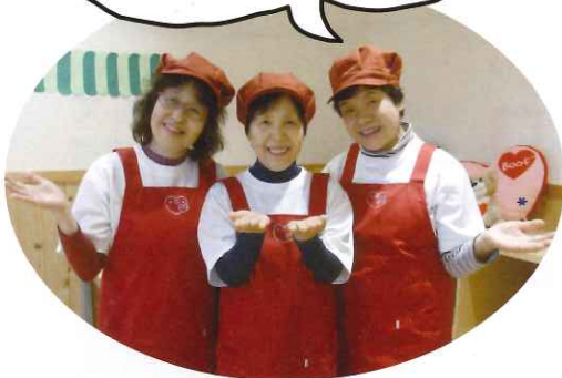
▲今年度 下半期のリーダーさんたち

いつからでも、ひとりでも 参加できますよ♡ 私たちと一緒に仲間づくり をしませんか？