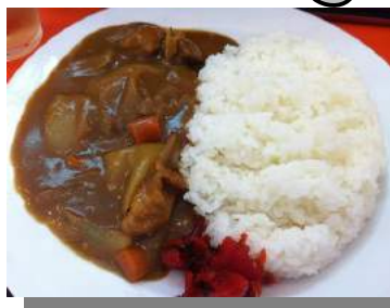
9月は“ポークカレー”（予定） ※イメージ写真