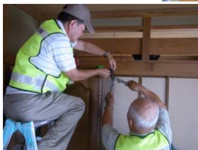
▲家具・場所に適した固定金具を取り付けます。

今年度は、昨年5月以降に高齢者見守り員さんの見守りを希望されたひとり暮らし高齢者を対象に、見守り員さんのご協力をいただき家具転倒防止事業希望調査を実施。希望された3名の方の寝室の家具転倒防止器具を取り付けました。