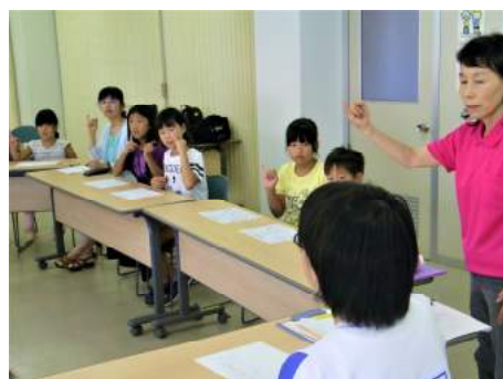
▲中学生が講師となって指導しています