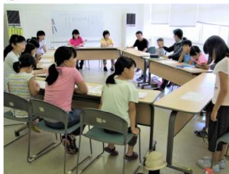
▲指文字表を見ながら自己紹介