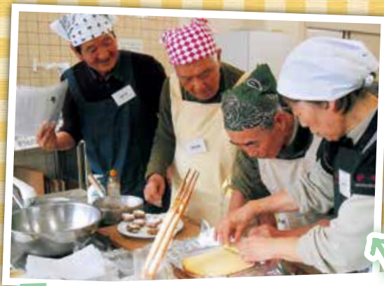
調理風景。グループに分かれて和気あいあいと、協力しながら作っています。