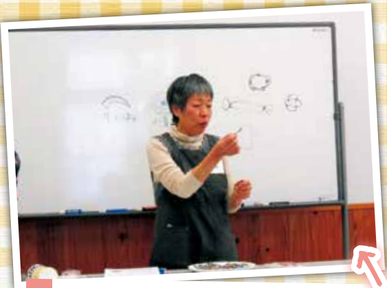
栄養士の先生から、調理方法や栄養についてのお話があり、とても勉強になります。