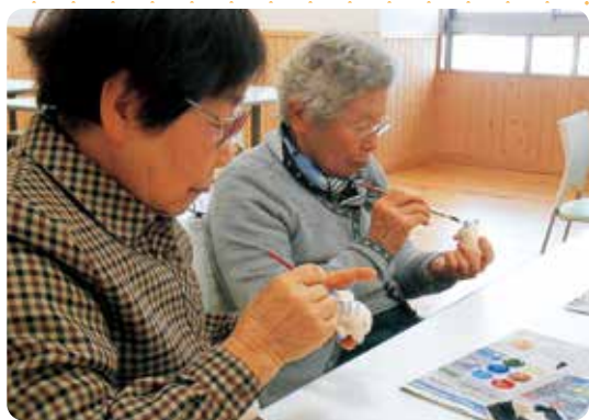
(写真左) 一次予防事業：陶芸教室 (写真右) 目玉焼き倶楽部