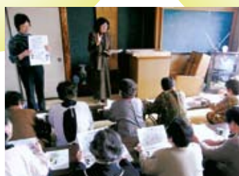
◀講師による学習会

レクリエーション遊具の貸出、各種機関(介護・健康・防犯など)の職員紹介なども行います。関心のある方はお気軽にご相談ください。