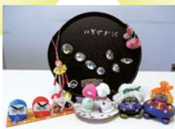
社協に届いた 手作り作品▶

伊予市社協からの助成金と、参加者の皆さんからの会費(1回300円など)を集めて運営しているサロンが多いようです。